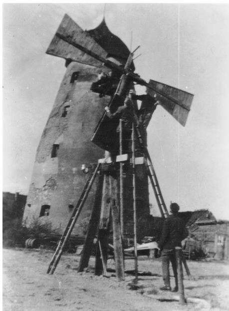
In den Jahren nach dem 2. Weltkrieg wurde der Versuch unternommen, die Windmühle mit „einfachen Mitteln“ wieder in Gang zu setzen, um mit ihr Strom zu erzeugen. Aufnahme ca. 1950.

Nach dem Krieg wurde der vordere Teil der hölzernen Welle abgesägt. Der schwere Kopf, an dem die Flügel befestigt gewesen waren, stürzte herab, wobei die Gebäudewand beschädigt wurde. Die Flügelwelle wurde ausgebaut und vor der Mühle aufgestellt. Für den etwa 1,5 Tonnen schweren eisernen Wellenkopf konnte man in der trostlosen Nachkriegszeit noch gute Schrottpreise erzielen. Zwei noch intakte Mahlgänge wurden Mitte der 1950er Jahre an die Windmühle Sorsum bei Wennigsen verkauft.