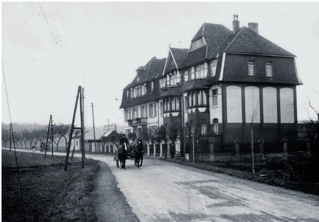
Pferdefuhrwerke auf der Straße Seelze-Almhorst in den 1930er Jahren

Wie seinerzeit üblich, wurde die Mühle ein Stück abseits der Straße errichtet, damit die Pferde vorbeikommender Fuhrwerke nicht durch die drehenden Flügel verschreckt wurden und scheuten.