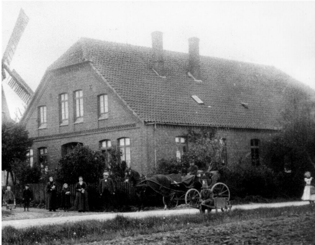
Das 1886 erbaute Wohnhaus mit Bäckerei etwa Anfang der 1920er Jahre