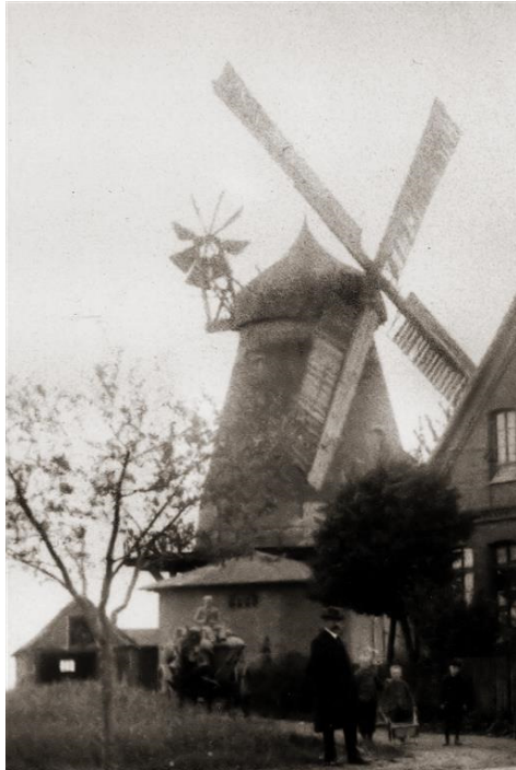
Die Windmühle mit damals modernster technischer Ausstattung etwa Anfang der 1920er Jahre

Zu seiner Zeit gehörte dieser Neubau zu den größeren Holländermühlen unserer Gegend. Das Gebäude war mit fünf Böden ausgestattet, einem Mahlgang für Weizen, einem für Roggen und einem Futterschrotgang. Ein „Fahrstuhl“ sorgte für den Transport der Mehl-, Schrot- und Getreidesäcke. Die wichtigsten Antriebsteile waren der Zeit gemäß aus Stahl, nur die Flügel und die mit ihnen verbundenen Bauteile bestanden noch aus Holz. Der Mühlenkopf war drehbar und wurde durch eine Windrose automatisch in den Wind gedreht, die Flügel waren mit Jalousieklappen ausgestattet.