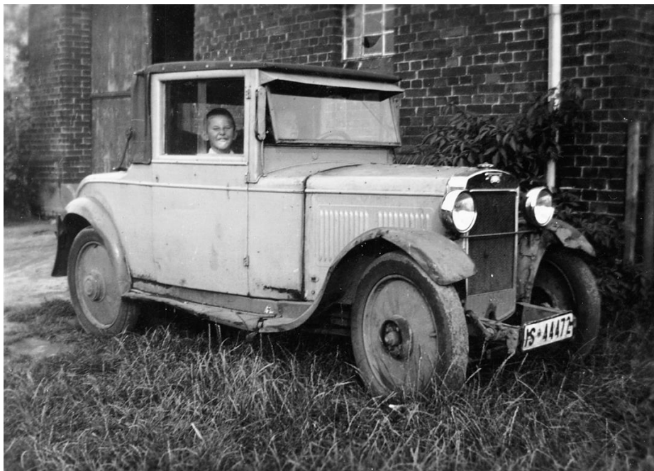
Automobil von Müller Rindfleisch, mit dem schon Anfang des 20. Jahrhunderts auch Backwaren ausgefahren wurden.

Um 1900 lief der Betrieb offenbar so gut, dass Wilhelm Rindfleisch den Mahlvorgang unabhängiger vom unzuverlässigen Wind gestalten wollte. Er ließ ein Maschinenhaus an die Mühle bauen, worin ein Gasmotor aufgestellt wurde. Mit diesem konnten die Mahlgänge bei zu schwachem oder ungünstigem Wind angetrieben werden. Später wurde der Gasmotor durch einen Ölmotor ersetzt.