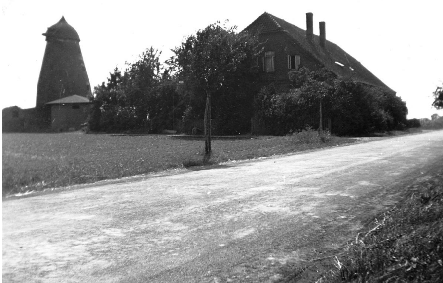
Mühle und Wohnhaus etwa Ende der 1930er Jahre